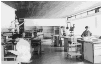
Die moderne Lehrwerkstatt mit der langen Fensterfront

Zur rationellen Bewältigung der Arbeit wird in die ersten, wirklich zweckmässigen Einzelmaschinen für die automatische Produktion investiert: Falzautomat, Deckenmaschine, Zusammentragmaschine, Einhängemaschine.