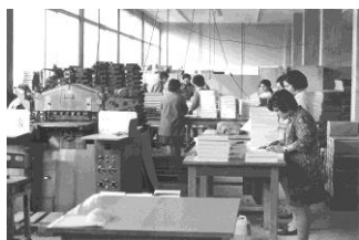
Partierarbeit in der Buchproduktion 1971 im Neubau in Reinach

1969 Eröffnung einer Sortimentsbuchbinderei an der Riehentorstrasse in Basel Vermehrte Aufträge für das Binden von Bibliotheksbinden führen zum Aufbau dieser speziell dafür eingerichteten Werkstatt.