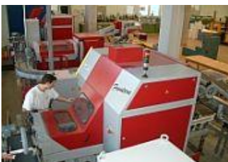
Frontero für den bündigen Vorderschnitt bei Klappen-Broschüren

Im Sommer 2002 können die Neubauten bezogen werden. Der von Grosspeter gemietete Erweiterungsbau ermöglicht es, die Aussenlager aufzulösen und an den Produktionsstandort zu verlegen. Die neue Spedition mit vier Andockkrampen und einem weiteren Warenlift ist eine erhebliche Erleichterung für die Logistik.