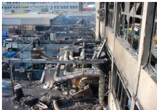
Bild der Zerstörung am Tag nach dem Brand

Am 20. März 1996 erhält die Buchbinderei Grollimund AG als erste Buchbinderei in der Schweiz die Anerkennung des Qualitätsmanagement-Systems mit dem Zertifikat nach ISO 9001.