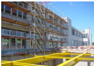
Nach der Sanierung des bestehenden Produktionsgebäudes konnte der Aufbau der zerstörten Lager- und Speditionsbauten erfolgen

Die Ursache für den Brand bleibt ein Rätsel. Erfreulicherweise hat das Ereignis keine Kundenverluste oder Entlassungen zur Folge.