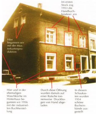
Im ersten Stock zog 1953 die Handbuchbinderei ein Hier begannen wir mit der Musterkartenproduktion Hier und in der ehemaligen Waschküche im Hinterhaus begannen wir 1956 mit der industriellen Buchherstellung Durch diese Öffnung wurden damals auf einer Rutsche tonnenweise Druckbogen vom Hand abgeladen In diesem Schaukasten wurden 1954 schöne Bucheinbände ausgestellt